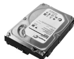
Festplatte 2 TB